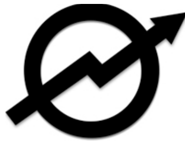
Symbool van de krakersbeweging